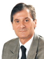
*Voir article de Jean-François PLANTIN Vice-Président, en charge notamment du contrôle de qualité

C'est l'occasion de vous annoncer que le Conseil National vient d'adopter une procédure D4 – D4. Cela signifie qu'un contrôle jugé insuffisant (D4) entraînera dans le délai de deux ans un second contrôle payant et qu'en cas d'insuffisance répétée (deuxième D4), considérée comme une négligence grave, la chambre de discipline devra être saisie. Je me suis élevé contre cette décision, j'ai toujours considéré que notre devoir de professionnels libéraux était d'accompagner, voire d'aider, nos confrères et surtout pas de les abandonner. Le D4 – D4 c'est le H5N1 du commissaire aux comptes.*